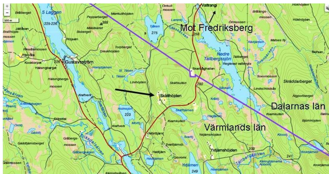
Topografiska kartan 2017: Skäfthöjden ligger i Värmland, men bara ca 1 km från gränsen till Dalarna. De två byggnaderna nordöst om Skäfftjärn räknas också till Skäfthöjden.

I slutet av 1600-talet togs ett antal skogsfinska nybyggen upp i de norra delarna av Värmlandsberg, i gränstrakterna mot Dalarna. Några av dessa uppfördes i Skäfthöjden 1 , ca 1 mil sydväst om Fredriksberg i Dalarna