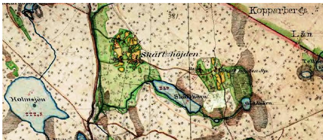
Häradsekonomiska kartan 1883-1895: Samma fem bosättningar då som nu, drygt 100 år tidigare. Nuvarande landsväg var ännu inte byggd utan vägen norrut mot Dalarna gick väster om bebyggelsen. Där finns även nu en skogsbilväg längs i huvudsak samma sträckning. (Notera ändringen av ortsnamnet i kartan från Skäftehöjden till Skäfthöjden. Båda namnformerna förkommer i de historiska dokumenten)

I dag 2017 finns två fastboende familjer i Skäfthöjden medan två hus nyttjas som fritidsboställen.