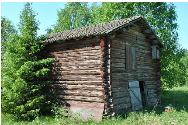
Rian 4 juni 2016