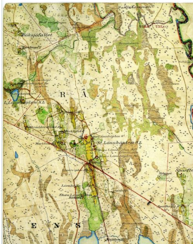
Ekonomiska kartan 1883-1895 (ovan) "Gröna kartan" 1990-tal